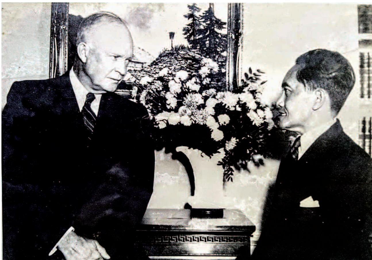
Illustration des proximités de souveraineté du PDG d'ExcelTrust International Son grand père son excellence Monsieur SUNARIO Saswardoyo, Ministre des affaires étrangères de l'Indonésie en tête avec l'ancien président américain Eisenhower Dwight.

de financement conventionnelles sont souvent limitées.