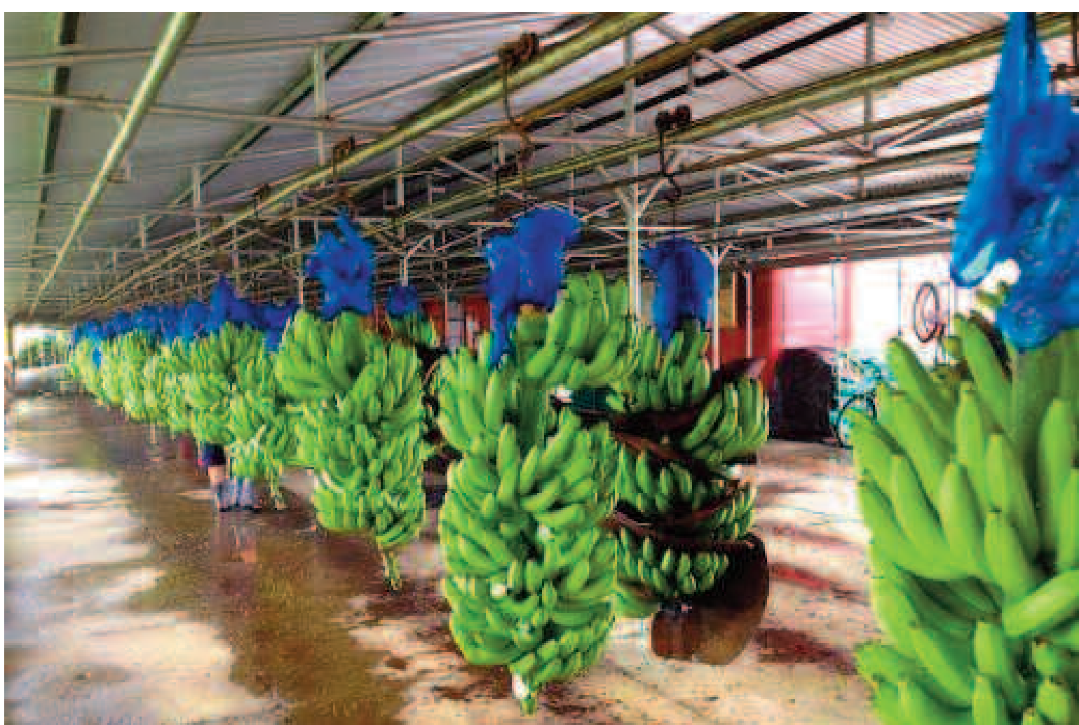
La banane douce cultivée dans la vallée volcanique de Njombé-Penja, dans la région du Littoral au Cameroun est un pilier de l'économie locale et moteur des exportations.

zaines de milliards, avec une grande flexibilité : souvent sans nantissement lourd ni obligation excessive d'autofinancement.