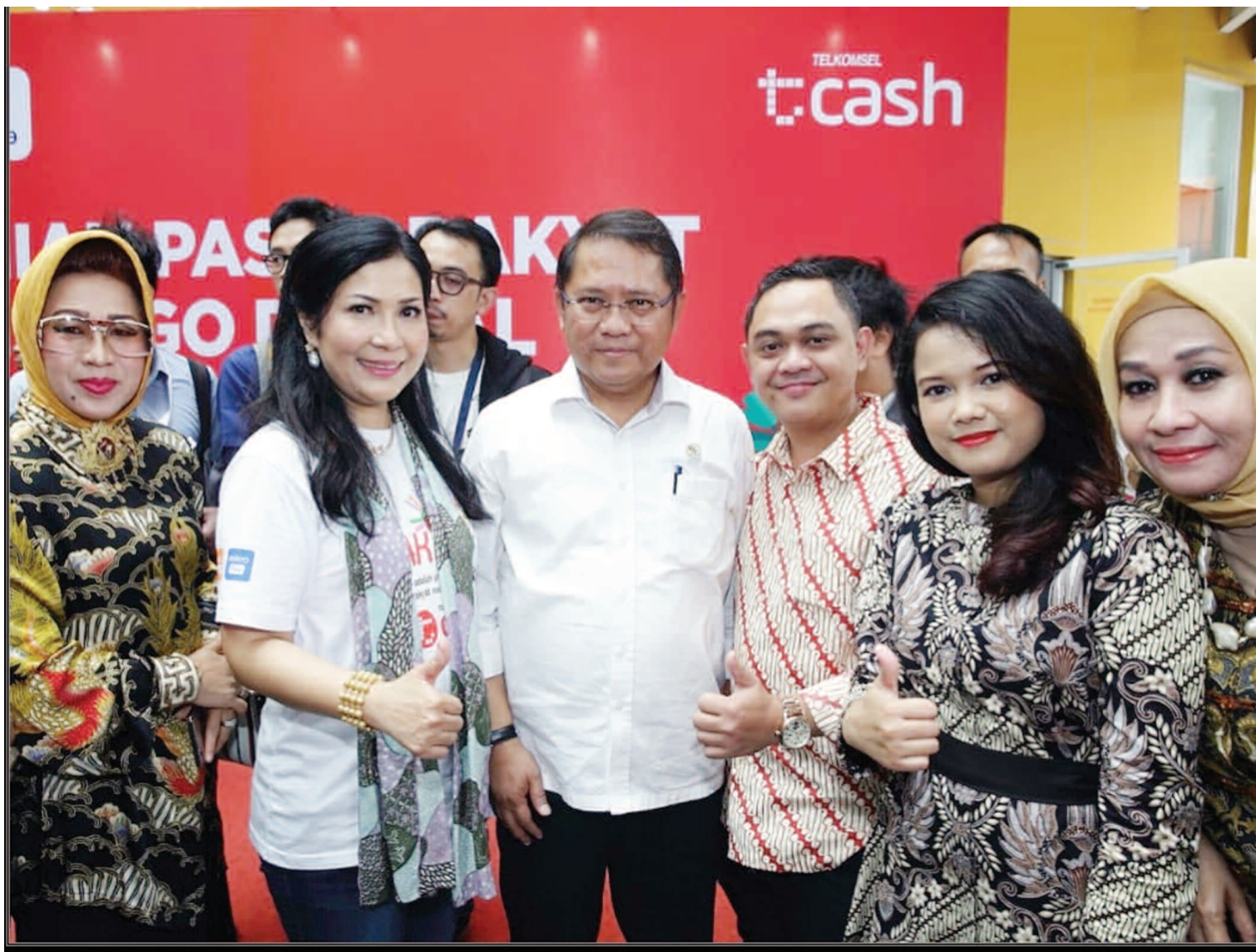
CEO-ExcellTrust with CEO INAMIKRO and Indonesia Minister of Communication & Technology Mr Rudiantara